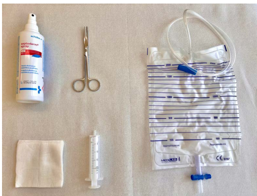
Obr. 1: Pomůcky k výměně sběrného sáčku (stříkačka, gázový čtverec, dezinfekce ve spreji, nůžky, vypustný sběrný sáček s hadičkou)

Svodný drén, který Vám byl zaveden na operačním sále, slouží ke spádovému odtoku tekutin po operačním zákroku, aby se zamezilo jejich hromadění v místě operační rány.