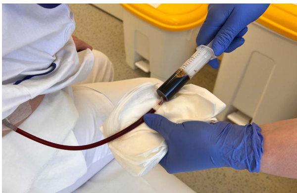
Obr. 5: Zprůchodnění ucpané hadičky

V takovém případě proveďte kontrolu hadičky, kde mohou být viditelné sraženiny, které brání posunu sekretu do sběrného sáčku. Pokud je drén ucpaný, rozpojte jej v místě spojení se sběrným sáčkem (provedte dezinfekci hadičky a nůžek a rozstříhnete). Připojte k drénu stříkačku, kterou jste od nás dostali při propuštění (je určena na jednorázové použití!), a vytvořte podtlak, který odsaje sraženinu a drén znovu zprůchodní (viz Obr. 5). Po odejmutí stříkačky proveďte dezinfekci hadičky a nasadte konec zpět na sběrný sáček. Je přísně zakázáno do drénu cokoli aplikovat nebo provádět neodborný proplach jakoukoli tekutinou.