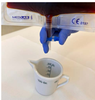
Obr. 4: Odměrná nádoba a vypouštěcí ventil

Každé ráno vypouštějte sběrný sáček pomocí křížové výpusti (modrý ventil v dolní části sáčku) do kalibrované odměrné nádoby, kterou lze zakoupit v lékárně. Otevřete ventil posunem do strany, čímž se sáček vyprázdní. Poté ventil vraťte do původní polohy, aby se uzavřel a výpusť otřete od zbytků sekretu. Cílem je přesně změřit objem denní sekrece v mililitrech (ml) za 24 hodin. Poznačte si množství vypuštěné tekutiny do tabulky (datum a objem sekrece v ml / 24 hod.) Tuto tabulku si vezměte na kontrolu po operaci.