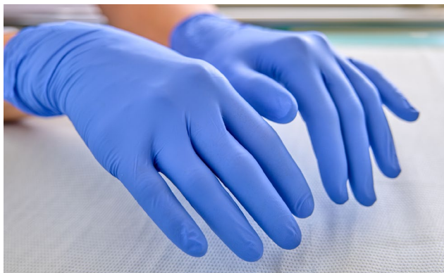
Obr. 3: Nitrilové rukavice.