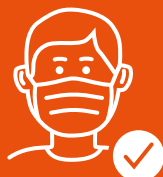
Správně nasazená ochrana úst a nosu.