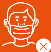
Špatně nasazená ochrana úst a nosu.

Prosíme, abyste nosili správně nasazený respirátor po celou dobu návštěvy v MOÚ.