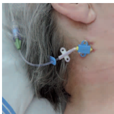
obr. č. 2 na krku (v. jugularis)