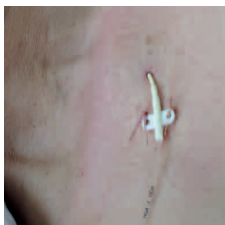
obr. č. 1 pod klíčkem (v. subclavia)