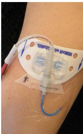
Obr. 2: Fixační podložka „StatLock“

PICC katétr může být fixován pomocí speciální fixační podložky „StatLock“ (obr. 2) nebo fixační pomůckou „SecurAcath“ (obr. 3).