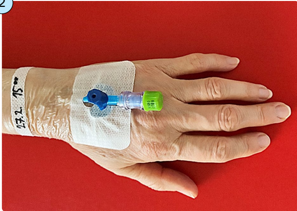
Obr. 2: Semitransparentní krytí u hospitalizovaného pacienta s vyznačením data a času výměny

Zevní koncovka flexily je v době mezi aplikacemi uzavřena bezjehlovým vstupem a zajištěna dezinfekčním uzávěrem. Dezinfekční uzávěr chrání flexilu před infekcí z vnějšího prostředí.