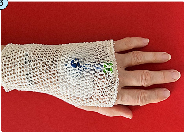
Obr. 3: Krytí flexily je často zajištěno ještě pružnou sítkou – prubanem