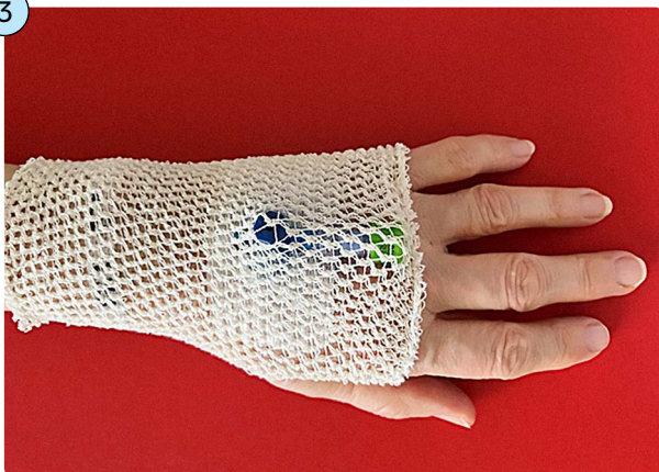
Obr. 3: Krytí flexily je často zajištěno ještě pružnou sítkou – prubanem