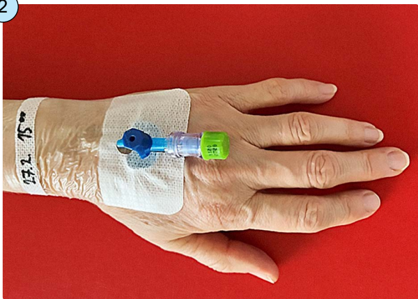
Obr. 2: Semitransparentní krytí u hospitalizovaného pacienta s vyznačením data a času výměny

Zevní koncovka flexily je v době mezi aplikacemi uzavřena bezjehlovým vstupem a zajištěna dezinfekčním uzávěrem. Dezinfekční uzávěr chrání flexilu před infekcí z vnějšího prostředí.