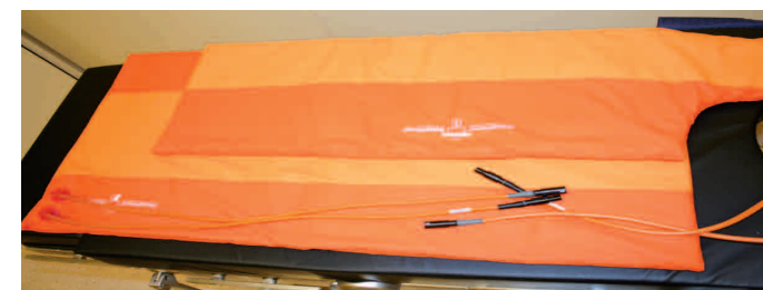
Obrázek 5: výhřevná podložka