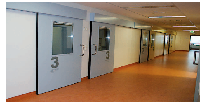
Obrázek 2: příjezd k jednotlivým operačním sálům