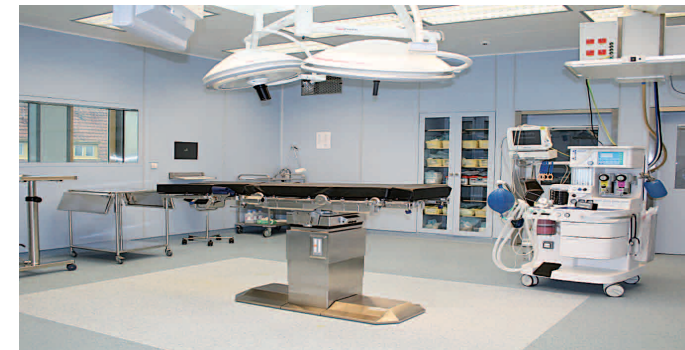
Obrázek 3: operační sál