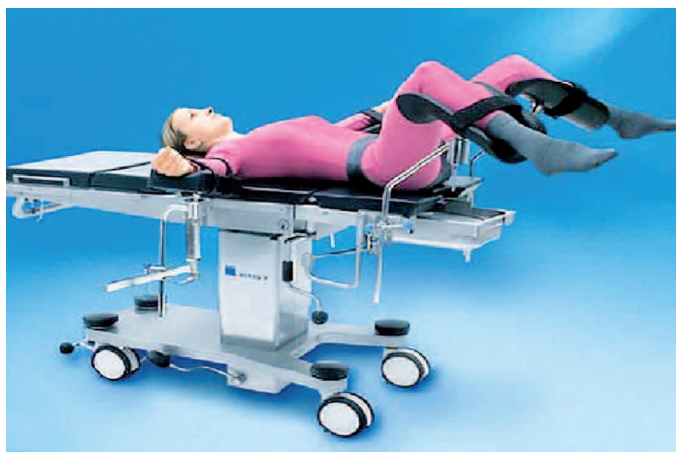
Obrázek 7: poloha gynekologická

Gynekologická poloha – vhodná pro výkony v gynekologii, výkony na orgánech v malé pánvi a urologii (obr. 7).