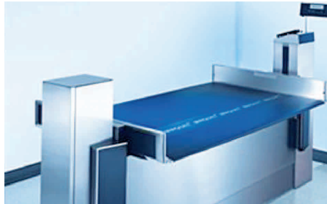
Obrázek 1: operační překládová deska