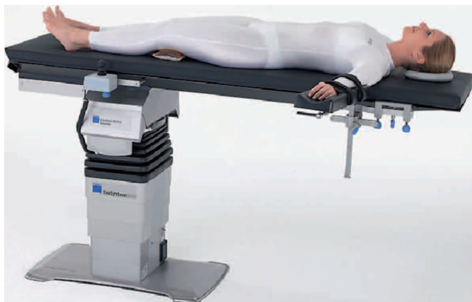
Obrázek 6: poloha na zádech

Poloha na zádech – se využívá při chirurgických, gynekologických a urologických výkonech prováděných abdominální (břišní) cestou (obr. 6).