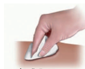
obr. č. 5

Pokud si všimnete drobné kapky krve v místě vpichu, můžete ji otřít tamponem (obr. č. 5). Místo vpichu nemasírujte. V případě potřeby překryjte místo vpichu náplastí s polštářkem.