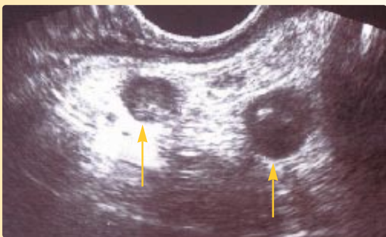
Ultrazvukový nález nádorem postižených uzlin před léčbou

Nabízíme Vám možnost konzultovat další postup Vaší léčby na konziliární ambulanci (ambulance č. 7) Masarykova onkologického ústavu. Ke konzultaci není potřebné objednáni předem , lze se informovat i v den Vašeho ultrazvukového vyšetření.