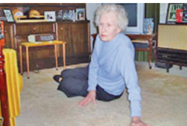
3. Vzepřu se na ruce