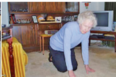
4. Zvednu se na ruce a kolena