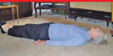
1. Otočím se na záda