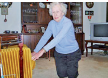
5. Ruce opřu o stabilní nábytek