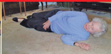
2. Přetočím se na bok