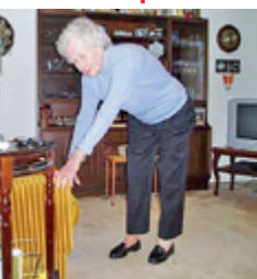
7. Postavím se