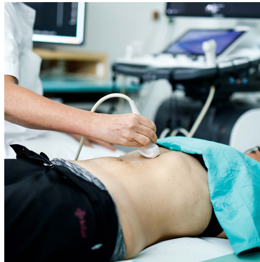
Obrázek 5 Ultrazvukové vyšetření lékařem