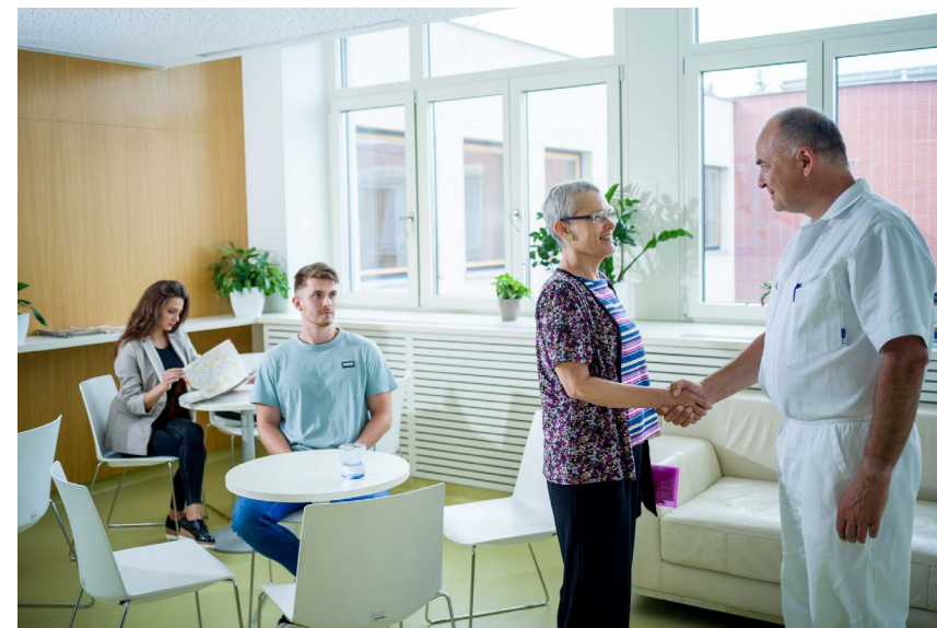
Obrázek 3 Centrum prevence