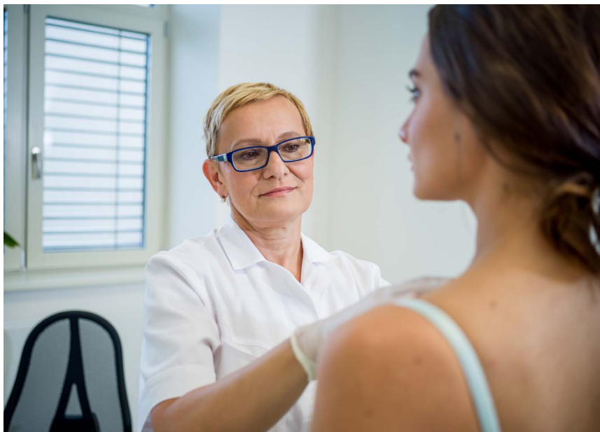
Obrázek 6 Ambulance mamární prevence